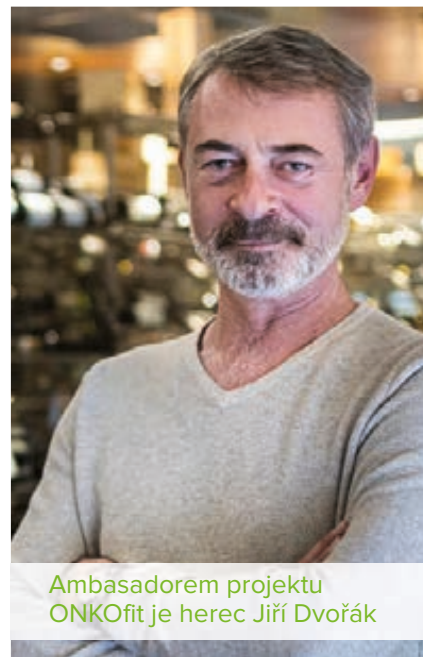
Ambasadorem projektu ONKOfit je herec Jiří Dvořák

V České republice žije kolem 600 000 onkologických pacientů. Léčba rakovinových onemocnění je velmi náročná a nese s sebou řadu nepříjemných vedlejších účinků. Je známo, že například až u 70 % pacientů se projevuje únava. Z tohoto důvodu je velmi důležité zahájit fyzickou aktivitu ještě před zahájením léčby, pokračovat v pohybu během ní, ale i po jejím ukončení. Kromě pozitivního vlivu na psychický stav zvládají aktivní pacienti lépe také samotný proces léčby a rekonvalescence. Věřte, že nikdy není pozdě